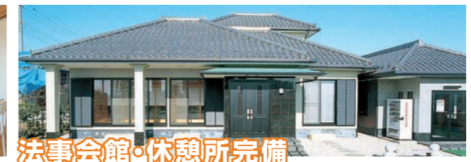
法事会館・休憩所完備