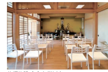
礼拝施設-会食室(洋室)