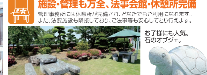
くつろぎのスペース